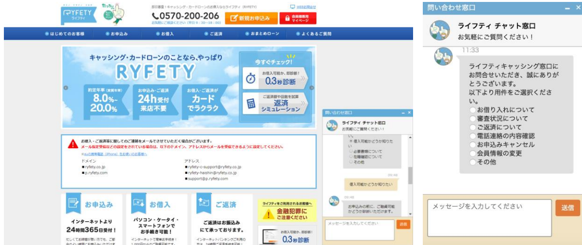
<チャット接客のイメージ>